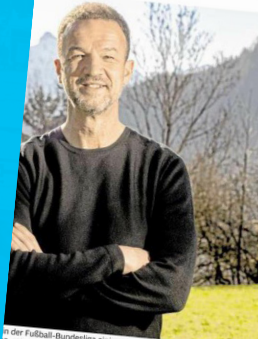
der Fußball-Bundesliga einiges erlebt. Im Rahmen seiner Tätigkeit für 3-Jährige nun nach Bad Hindelang.

Karrieretipp für den Fußball-Profi w er erstmals konkreter über die eigene